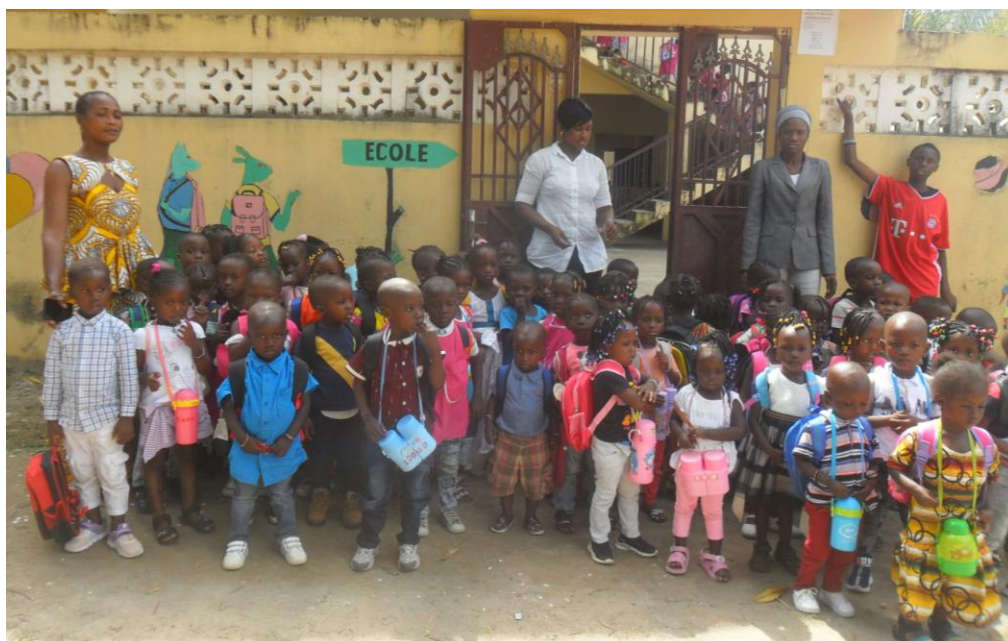
Rentrée novembre 2022

Tout d'abord, un grand merci à vous tous qui permettez depuis plusieurs années à 150 et cette année à 168 enfants, d'aller à l'école.