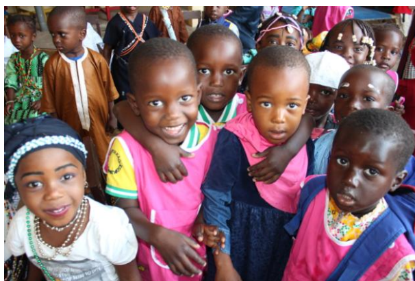
Les enfants sourient sur les photos

« J'ai fait des temps individuels en peinture avec les enfants de la classe de petite section. Ça me permet de les observer et d'apprendre à connaître chacun d'eux. Et aussi d'entrer en relation avec les plus timides d'entre eux.