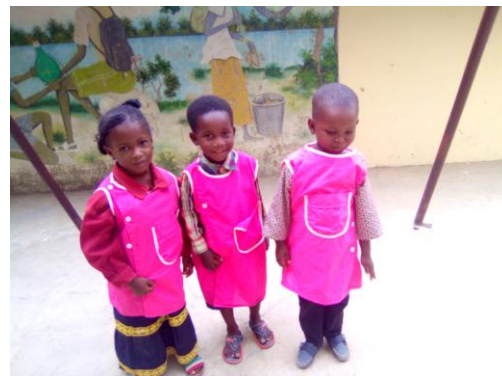
Ils sont 10 cette année

« Ici, j'oublie même parfois l'existence du covid. Je n'ai pas entendu parler de personnes malades. Le masque n'est exigé nulle part, à part dans les hôpitaux et à l'aéroport. »