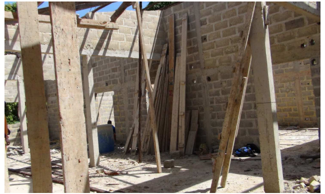
Le maçon et les travaux du premier étage