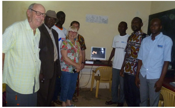
Installation terminée !