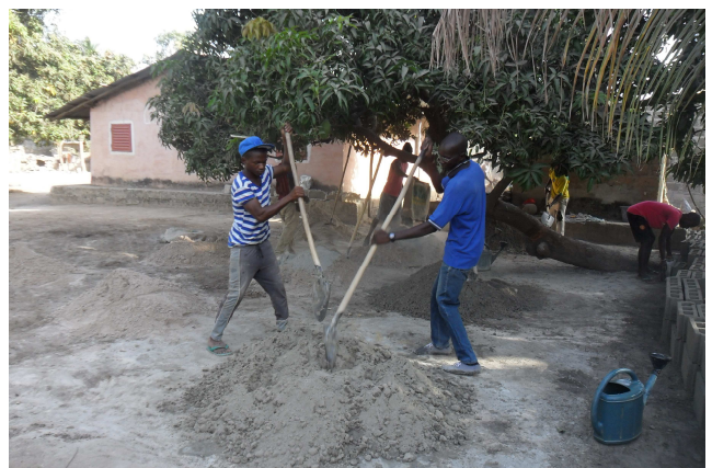
Arrivée du ciment et fabrication des moellons