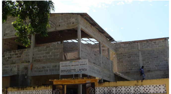
A notre arrivée et pendant le séjour