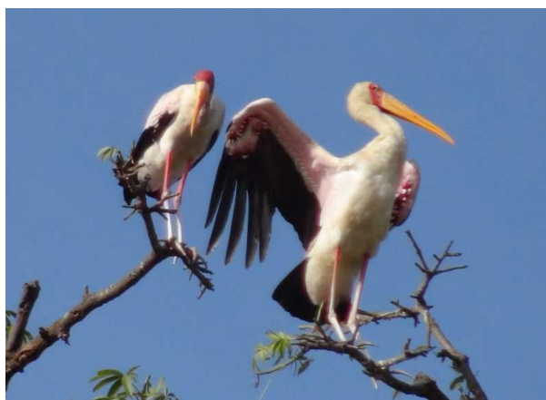
Tental ibis, sorte de cigogne