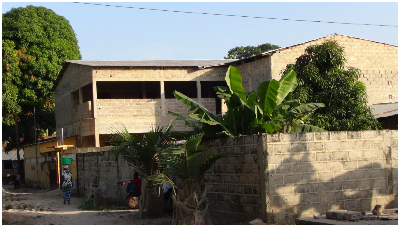
Huit jours après notre arrivée, le toit est terminé !