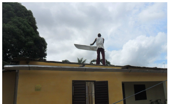
7 000 moellons !!! et démontage du toit