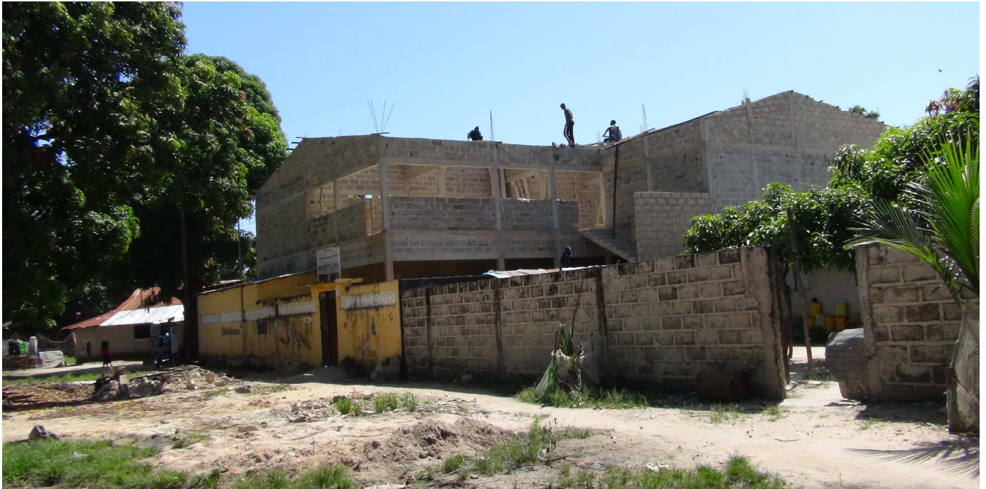
Les travaux d'extension de l'école en novembre 2015