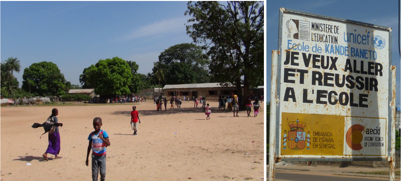
L'école élémentaire de Kandé Banéto, à Ziguinchor, au Sénégal

L'Ecole Elémentaire de Kandé Banéto a été créée en 2005 et compte 520 élèves répartis dans 10 classes ce qui fait une moyenne de plus de 50 élèves par classe. Certaines classes en ont 70 !! Au Sénégal, un enfant rentre à l'école primaire dans la classe de CI (Classe d'Initiation) puis au CP et ensuite comme en France.