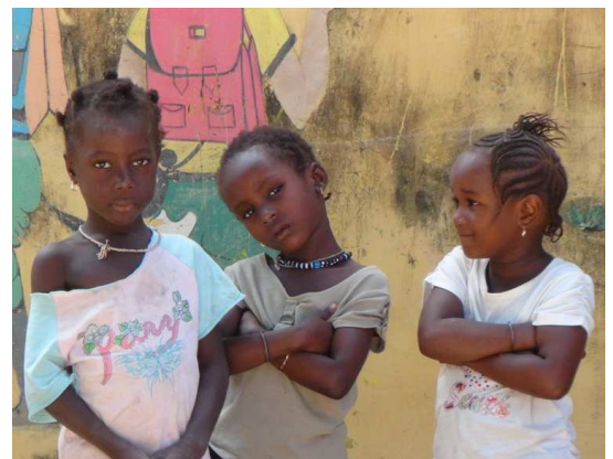
Enfants du quartier