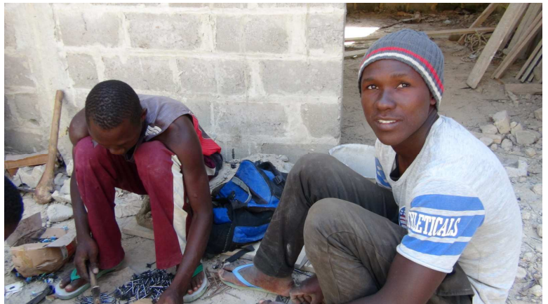
Fabrication des pointes qui tiendront les tôles du toit.

Pour éviter les infiltrations, les pointes ont la tête protégée avec un morceau de chambre à air qui fera joint.