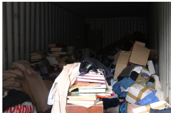
Ouverture des cartons après le travail des termites